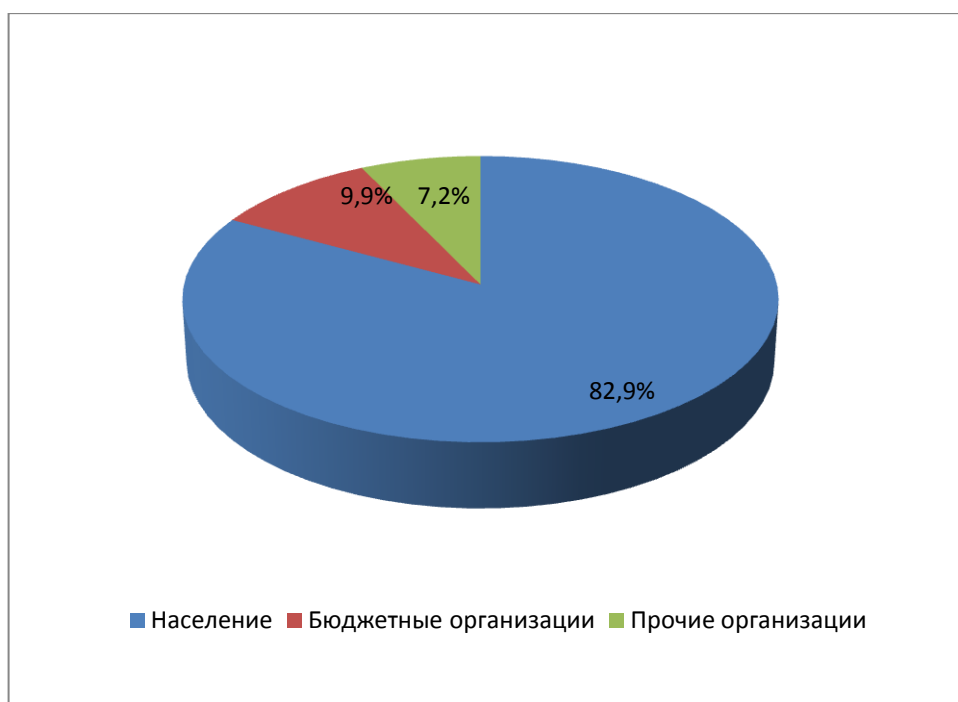
Рисунок 3.2. Структурный водный баланс Советского городского поселения

Структурный водный баланс реализации воды по группам потребителей представлен в таблице 3.3 (годовой и в сутки максимального водопотребления). Нормы расхода воды в сутки наибольшего водопотребления указаны в СНиП 2.04.01-85* «Внутренний водопровод и канализация зданий».